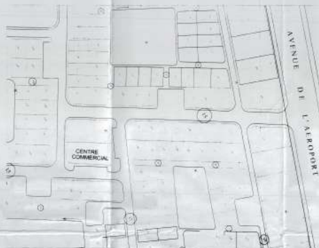
Plan de situation Ech: 1/2500