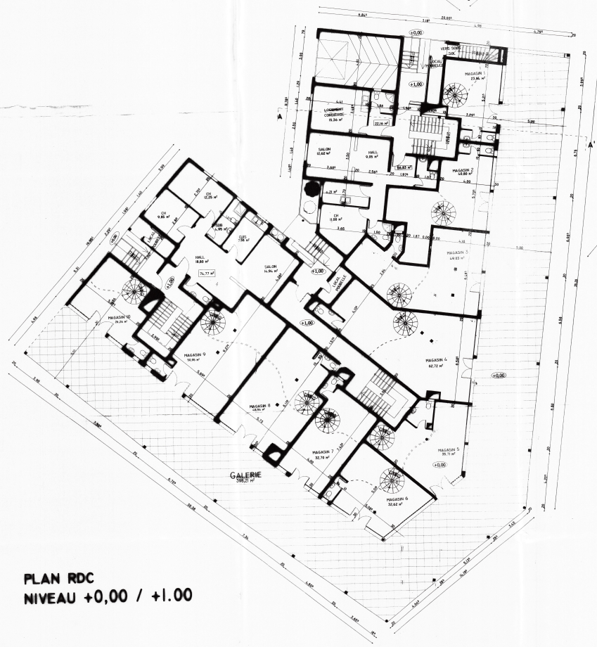
PLAN RDC NIVEAU +0,00 / +1,00