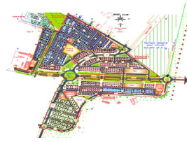
تجزئة البستان الشطر 1