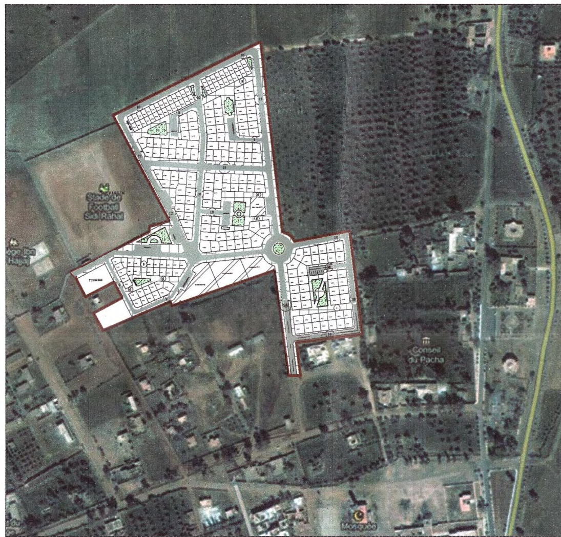
INSERTION SUR LE SITE

Py du 03/03/2011 Signature: Mohammed FRAZI Signature: GUESSOUS (EU) Signature: SAIBOLIK UNANS